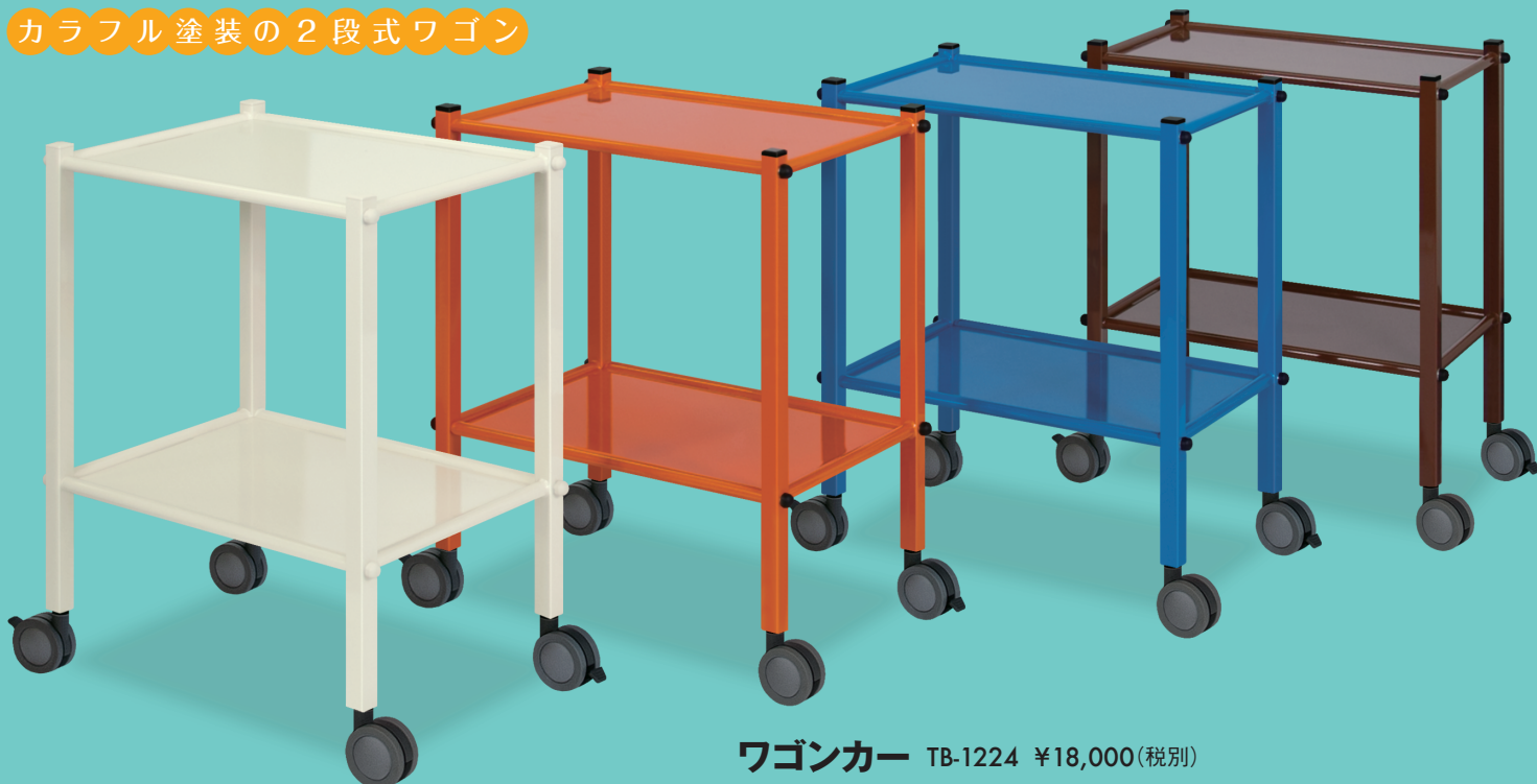
ワゴンカー TB-1224 ¥18,000(税別)