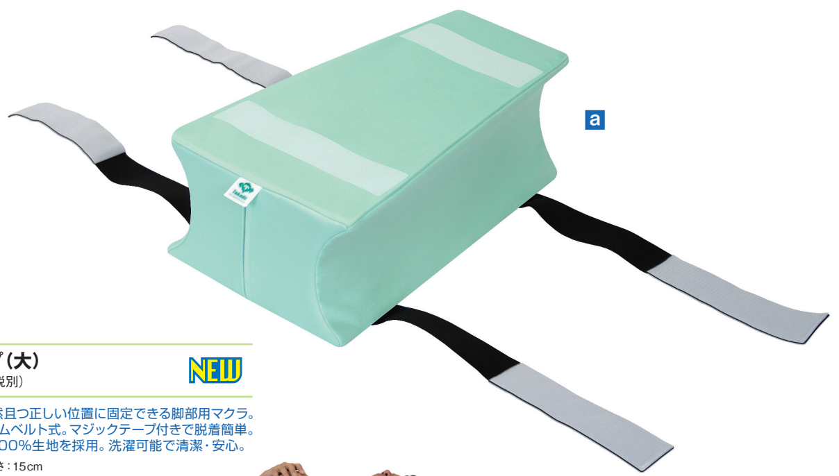
a ポジションキープ (大) TB-1335-01 ¥12,000(税別)