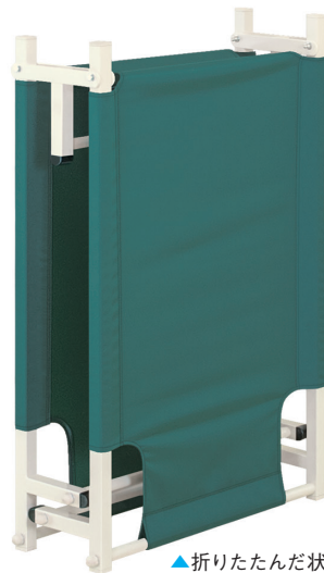
▲折りたたんだ状態