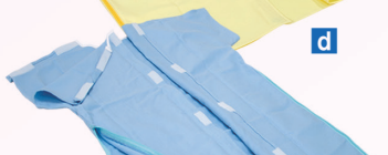
2PDX用上着(バストパット付き) 着用例