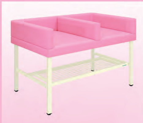
オムツ交換台 (ダブル) TB-731 ¥110,000(税別)