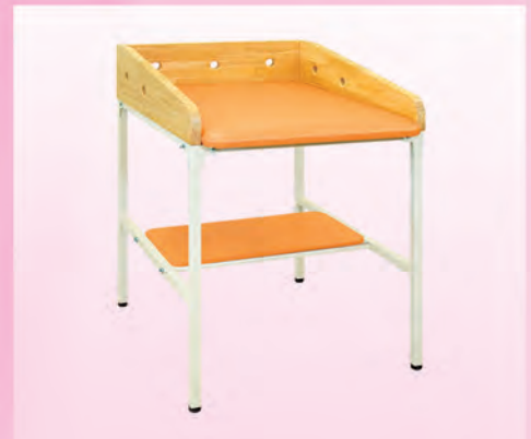
TB製オムツ交換ベッド TB-1115 ¥100,000(税別)