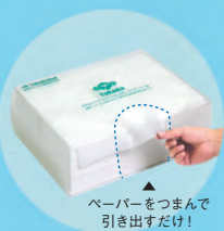
▲ペーパーをつまんで引き出すだけ!