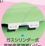
ガスシリンダー式 背脚角度調節レバー