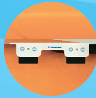
ガスシリンダー式 背脚角度調節レバー