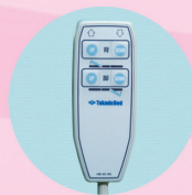
背脚連動式 手元スイッチ