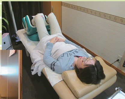
施術前の待ち時間に待合室で気軽に行える時間・価格設定も可能にする フットマッサージHogushi(コインタイマー付き) TB-1371 ¥115,000(税別)も販売しております。