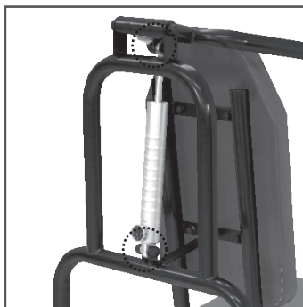
○ 摩擦音の発生する箇所

● 市販の潤滑スプレー又はグリーススプレーで、3ヶ月を目安に左記の可動部分に適量を吹き付けてください。 吹き付けを怠ると、がたつきや摩擦音の原因となります。