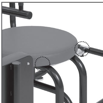
○ 摩擦音の発生する箇所

● 市販の潤滑スプレー又はグリーススプレーで、3ヶ月を目安に左記の可動部分に適量を吹き付けてください。 吹き付けを怠ると、がたつきや摩擦音の原因となります。