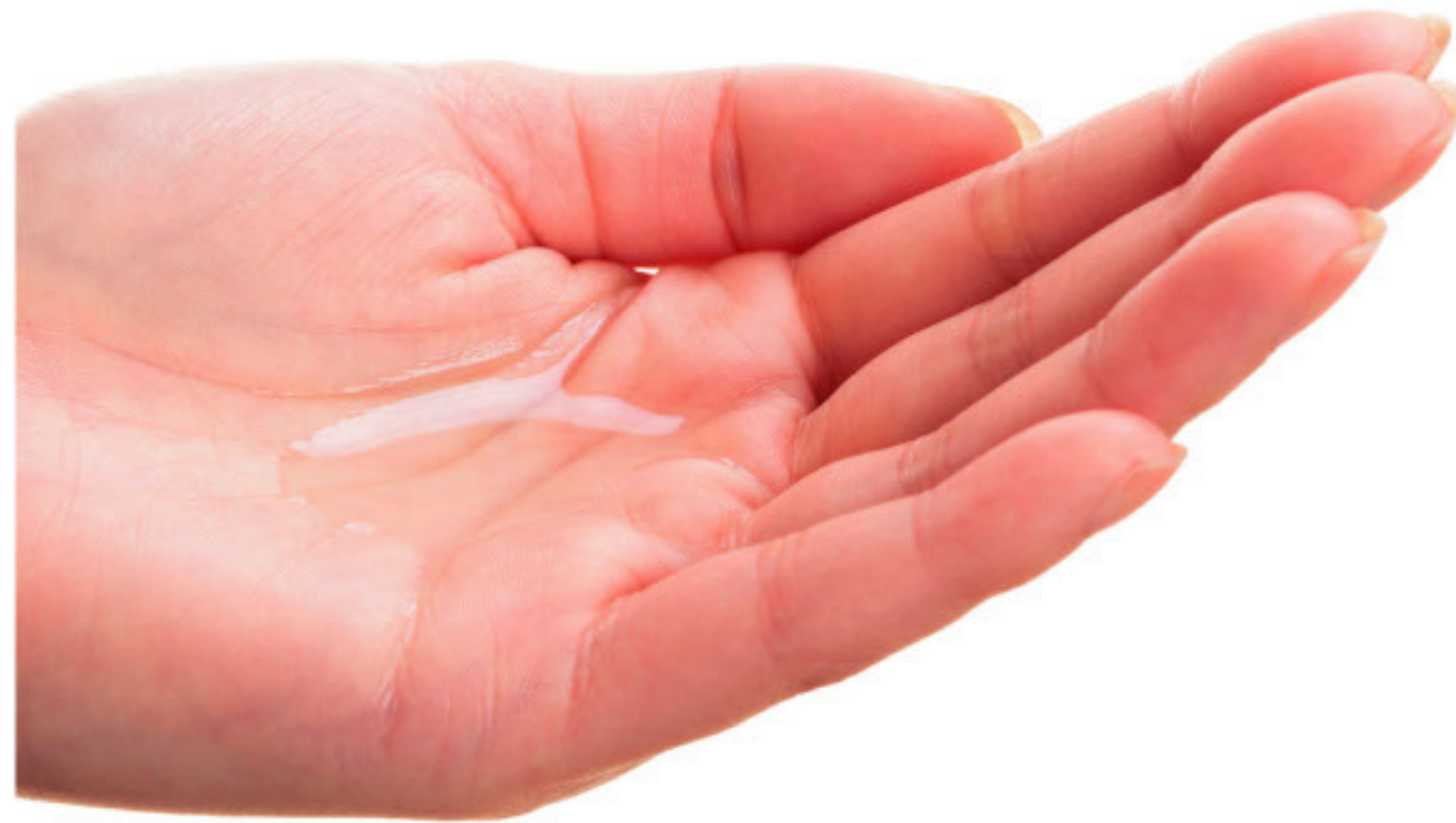
500円玉大を手にとります。