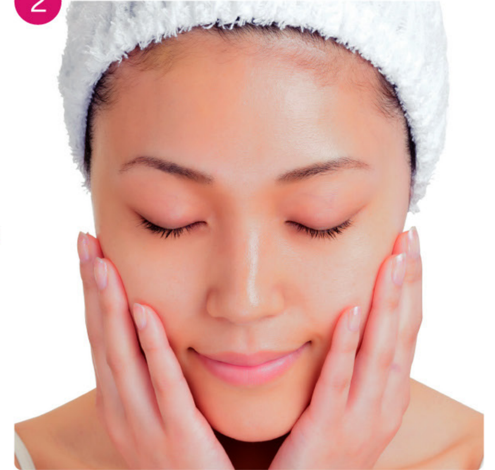
顔全体にやさしくなじませます。