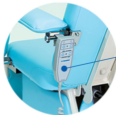
角度調節用 手元スイッチ