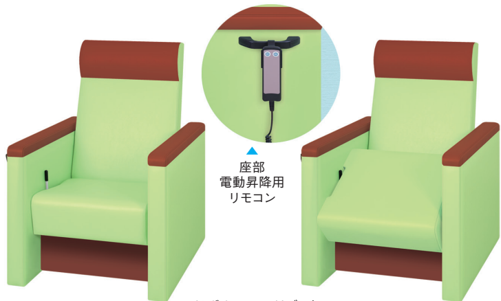
ライムグリーン×ライトブラウン