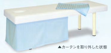
▲カーテンを取り外した状態