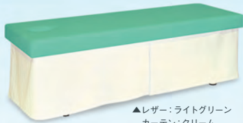
▲レザー:ライトグリーン カーテン:クリーム