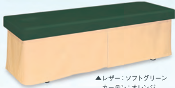
▲レザー:ソフトグリーン カーテン:オレンジ