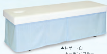
▲レザー:白 カーテン:ブルー