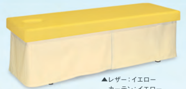
▲レザー:イエロー カーテン:イエロー