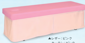
▲レザー:ピンク カーテン:ピンク