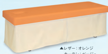
▲レザー:オレンジ カーテン:ベージュ