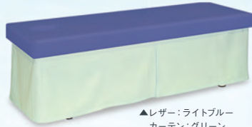
▲レザー:ライトブルー カーテン:グリーン