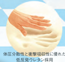
体圧分散性と衝撃吸収性に優れた低反発ウレタン採用