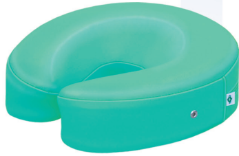
▲ケアフェイスマット TB-77C-28 定価¥7,500(税別) 幅:28cm 奥行:28cm 高さ:8cm