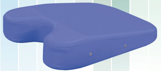
▲ケアバス(エアホール有り) TB-77C-27 定価¥7,500(税別) 幅:42cm 奥行:50cm 高さ:3/11cm