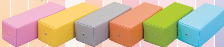
▼カラー角マクラ TB-77C-01 定価¥1,400(税別) 幅:27cm 奥行:11cm 高さ:9cm