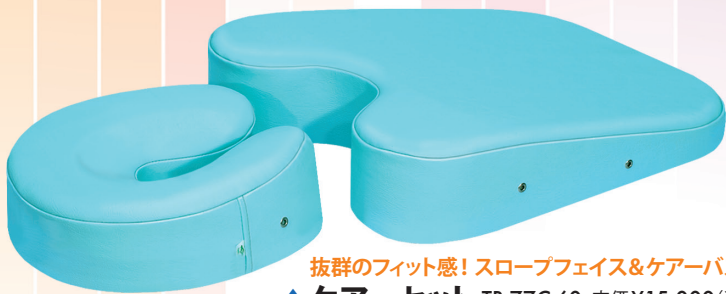
抜群のフィット感! スロープフェイス&ケアバスのセット ▲ケアセット TB-77C-60 定価¥15,000(税別) ●スロープフェイス/幅:28cm 奥行:28cm 高さ:8/11cm ●ケアバス/幅:42cm 奥行:50cm 高さ:3/11cm(エアホール有り)