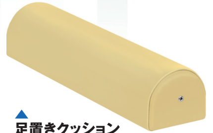
▲足置きクッション TB-77C-39 定価¥4,800(税別) 幅:50cm 奥行:13cm 高さ:11cm