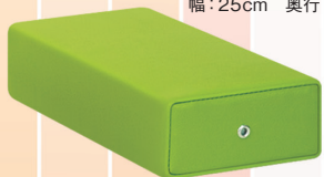
BR額マクラ(小)▲ TB-77-11 定価¥1,200(税別) 幅:25cm 奥行:13cm 高さ:4.5cm