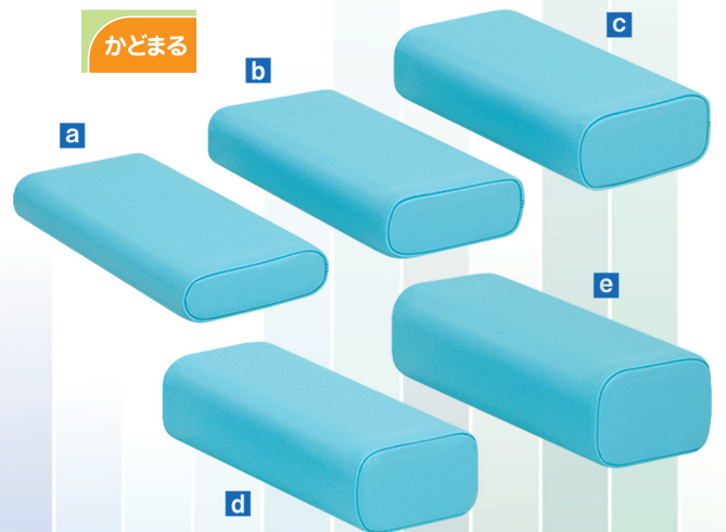
リーズナブルなセット価格! かどまる5点セット TB-77C-112 定価¥13,900(税別)