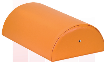
▼カラー額マクラ(小高) TB-77C-10 定価¥1,700(税別) 幅:25cm 奥行:13cm 高さ:6cm