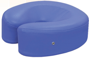
▲スロープフェイス TB-77C-03 定価¥7,500(税別) 幅:28cm 奥行:28cm 高さ:8/11cm